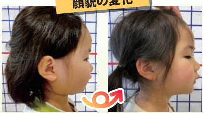
《装置使用前》 《3ヵ月後》