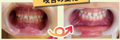
《装置使用前》 《3ヵ月後》